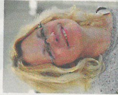
von Britta Hamann

W ir verschmutzen tagtäglich unsere Meere. Seit Jahrhunderten wird auch die Nordsee als Müllkippe benutzt. Vor allem der Plastikmüll gefährdet dort inzwischen massiv das Leben der Tiere – ob Fische, Robben oder Seevögel. Und damit ist auch unser Leben in Gefahr, weil wir das Plastik beim Fischen wieder aufnehmen. Den Kampf gegen den Plastikmüll haben jetzt auch Schüler des Jugendaufbauwerks (JAW) Dithmarschen aufgenommen. Nach einer intensiven theoretischen Vorbereitung im Unterricht zum Thema Verschmutzung der Meere, ging es nach Büsum. Dort gab es Informationen auf dem Krabbenkutter SC 7 Seefuchs. So landeten etwa Unmengen von Plastik und sonstiger Müll als „Beifang“ in den Netzen der Fischer, und damit verbunden steht es auch um die Gesundheit der Fische nicht gut. Danach ging es für die Schüler und ihre Lehrer auf Müllsammel-Tour am Strand von Büsum entlang. Und da staunten die Jugendlichen nicht schlecht, wie viel Plastik von den Menschen einfach achtlos weggeworfen wird. Ein toller Umweltunterricht des JAW, finde ich. Machen wir's den Jugendlichen nach und sammeln doch auch mal 'ne Runde Müll am Strand von Büsum.